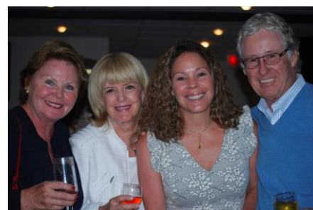
Participants à l'événement golf-vélo