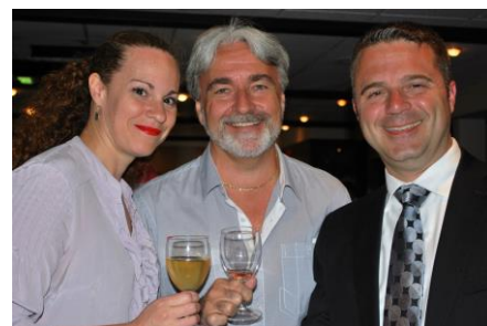
Participants à l'événement golf-vélo